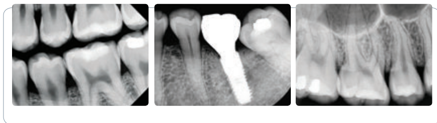
Imagen clara y segura

EzRay Premium proporciona valor diagnóstico con su avanzada tecnología.